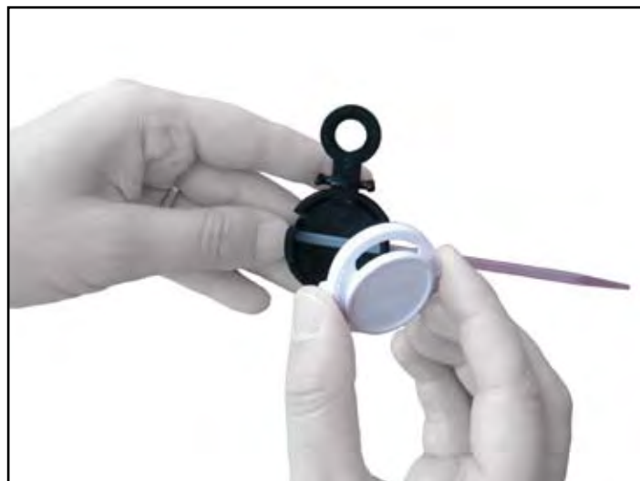
Colocação do chip na base