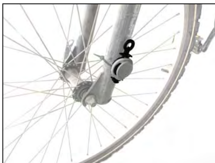
Colocação da base com o chip na BTT