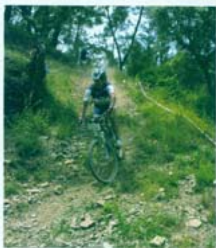
Mais variado tecnicamente, o percurso também alternava nas paisagens, atravessando povoações