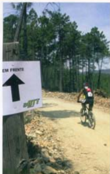
Em frente é o caminho. Em baixo, a Lan Sport, novamente responsável pela registo dos tempos