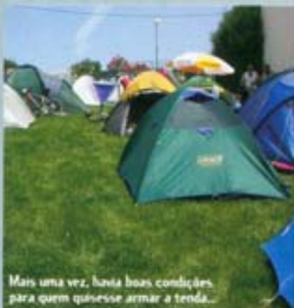
Mais uma vez, havia boas condições para quem quisesse armar a tenda...

O percurso era, obviamente, bastante diferente. Quando comparado com o do ano passado, era muito mais variado: não só ao nível do terreno como das paisagens, altimetria e dificuldade, quer física quer técnica. Tecnicamente era mais complexo, tendo inclusive algumas zonas onde era imperativo